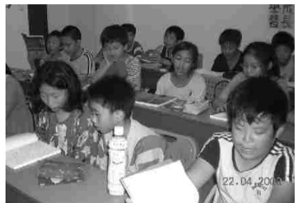
▲週三晚上經典教育課程。