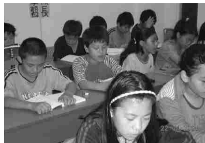
▲聚精會神 認真朗誦。